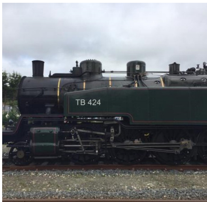
LOCOMOTIVE CARHAIX-PLOUGUER (29)

L'église de Loc-Envel conserve un remarquable ensemble de statues en bois polychrome inscrites ou classées au titre des monuments historiques, datées des XV e et XVI e siècles et de styles variés, situées dans le chœur de l'édifice. La Vierge à l'enfant présente une iconographie originale. Elle est placée sur un croissant de lune et surmonte l'arbre de Jessé. L'arbre de Jessé est un motif fréquent dans l'art chrétien entre le XIII e et le XV e siècle : il représente une schématisation de la généalogie de Jésus, c'est-à-dire l'arbre généalogique présumé du Christ à partir de Jessé, père du roi David. La restauration vise à rendre la cohérence globale à l'œuvre et à retirer des repeints afin de rendre le décor d'origine et ses brocarts appliqués.