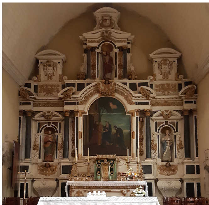
RETABLE VERGÉAL (35)

Le grand retable de Vergéal, entièrement sculpté dans le tuffeau, est composé de manière classique : une forte travée centrale reçoit, au-dessus de l'autel et du tabernacle, un tableau encadré de colonnes de marbre noir supportant un entablement cintré, et au niveau supérieur une niche abritant une statue également encadrée de colonnes. Les deux travées latérales sont occupées par une crédence galbée au niveau du soubassement, surmontée d'une niche à statue. L'ensemble est couronné d'attiques à fronton cintré portant des armoiries. Les parties en bois sont vermoulues, en particulier les gradins de l'autel. Les degrés ont été remplacés. Ce retable nécessite une restauration. En effet la traversée des siècles et les mauvaises conditions de conservation ont considérablement abîmé ce chef-d'œuvre.