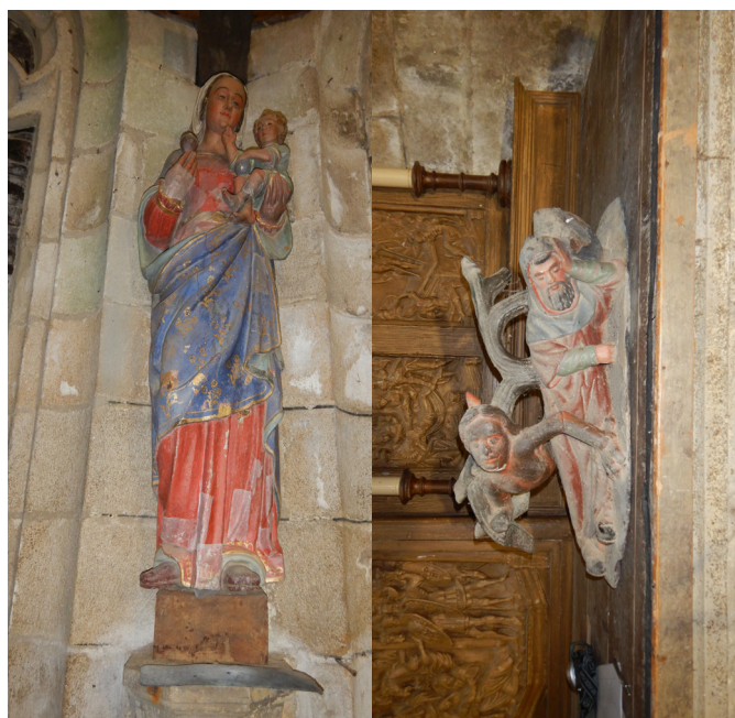
VIERGE À L'ENFANT ET ARBRE DE JESSÉ LOC-ENVEL (22)

Le grand retable de Vergéal, entièrement sculpté dans le tuffeau, est composé de manière classique : une forte travée centrale reçoit, au-dessus de l'autel et du tabernacle, un tableau encadré de colonnes de marbre noir supportant un entablement cintré, et au niveau supérieur une niche abritant une statue également encadrée de colonnes. Les deux travées latérales sont occupées par une crédence galbée au niveau du soubassement, surmontée d'une niche à statue. L'ensemble est couronné d'attiques à fronton cintré portant des armoiries. Les parties en bois sont vermoulues, en particulier les gradins de l'autel. Les degrés ont été remplacés. Ce retable nécessite une restauration. En effet la traversée des siècles et les mauvaises conditions de conservation ont considérablement abîmé ce chef-d'œuvre.