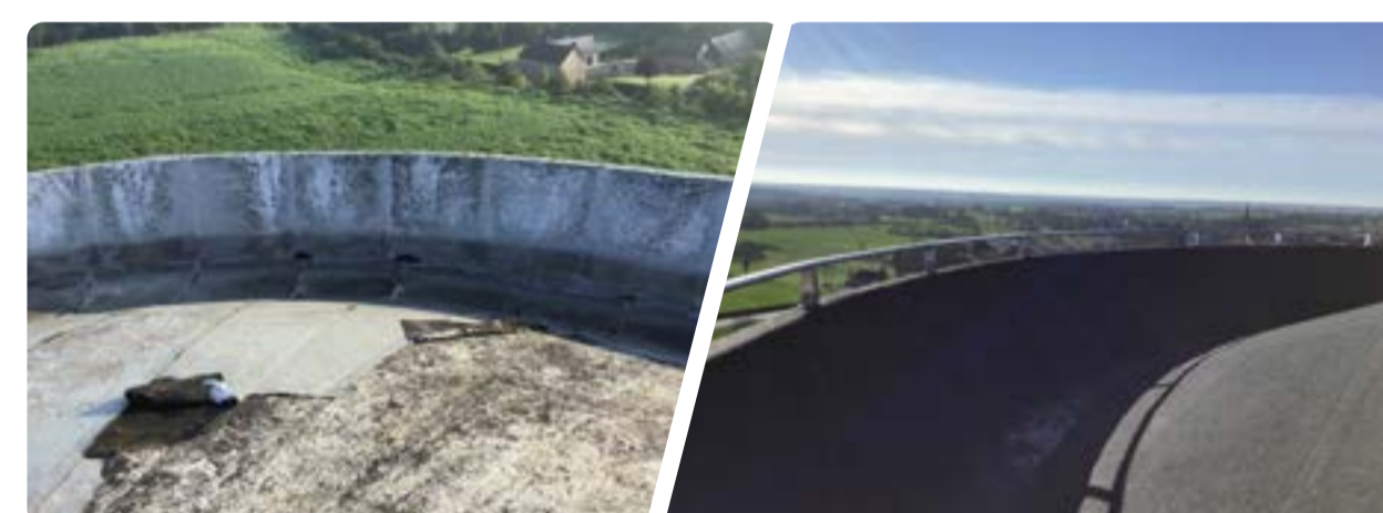
Reprise de l'étanchéité du dôme de la tour par la pose d'un voile bitumineux et installation d'un garde corps.