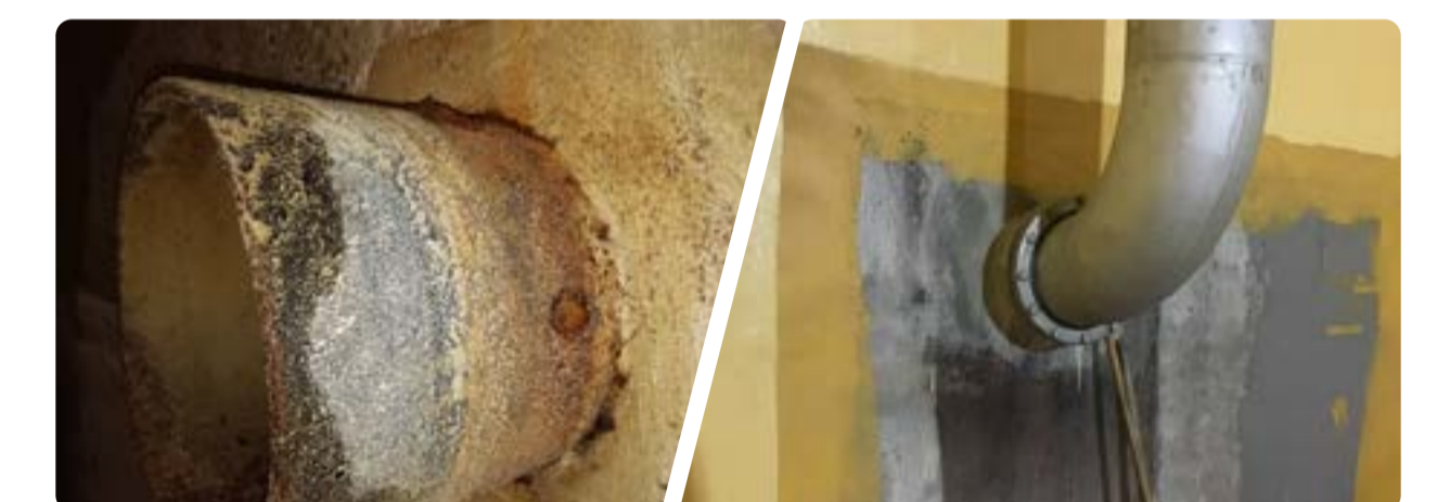
Réservoir semi-enterré : changement des manchettes d'ancrage.