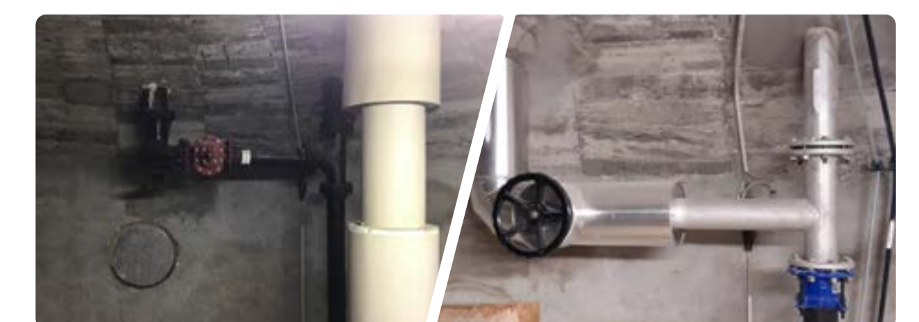
Réservoir sur tour : changement des manchettes d'ancrage et du vannage.

Reprise intégrale de l'étanchéité des cuves