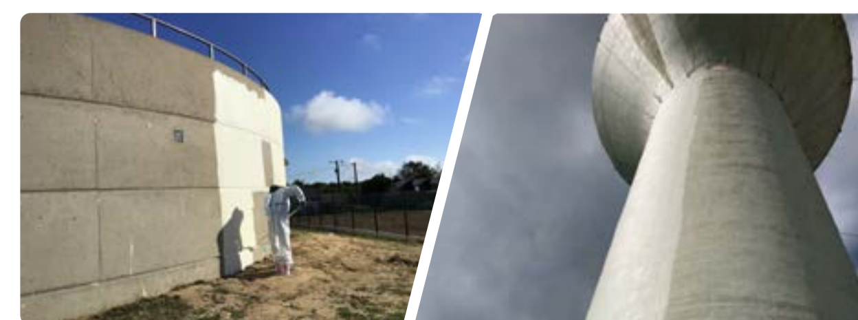
Application d'une peinture résistante aux intempéries sur la paroi extérieure.

Décapage, test à l'arrachement, sablage puis étanchéification de l'intérieur des cuves avant remplissage