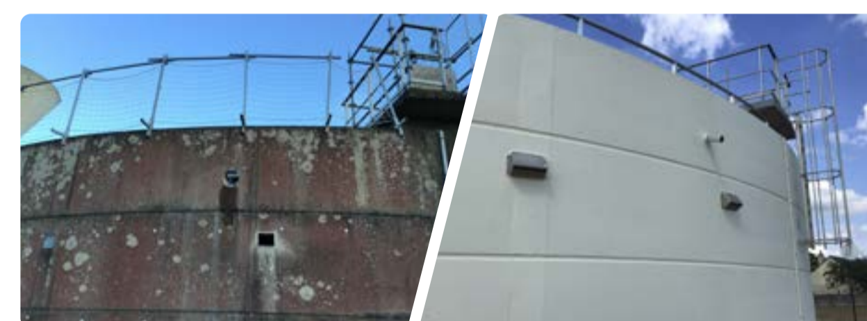
Création des évacuations des eaux de pluie et renouvellement des aérations.