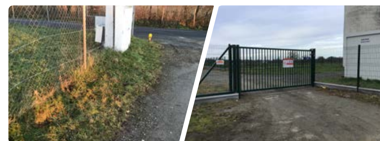
Autour du réservoir : installation d'un grillage de 2 mètres de haut et d'un portail de sécurité.