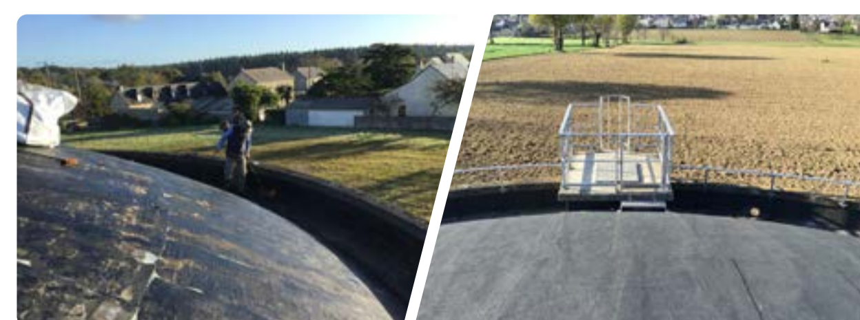
Reprise de l'étanchéité du dôme semi-enterré par la pose d'un voile bitumineux et installation d'un garde corps.