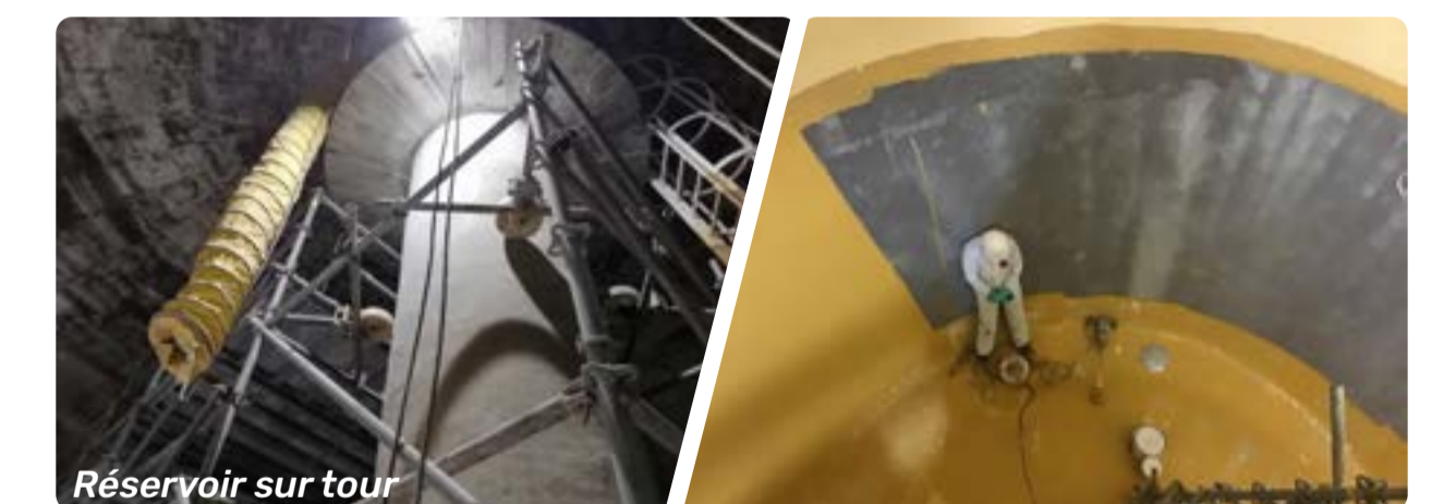
Réservoir sur tour

Décapage, test à l'arrachement, sablage puis étanchéification de l'intérieur des cuves avant remplissage