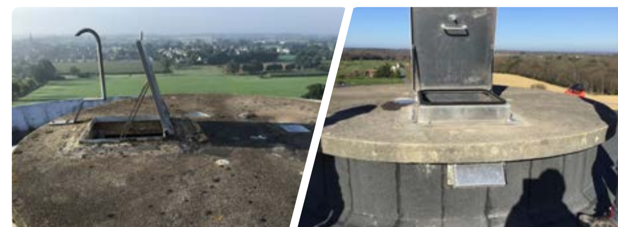
Pour la tour : normalisation de la trappe d'accès du dôme...